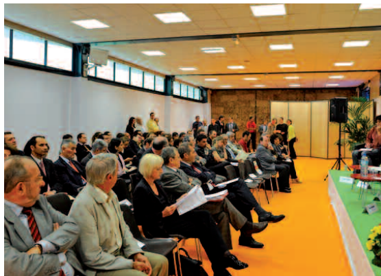
Table-ronde "PROJET EN CAMPAGNE"