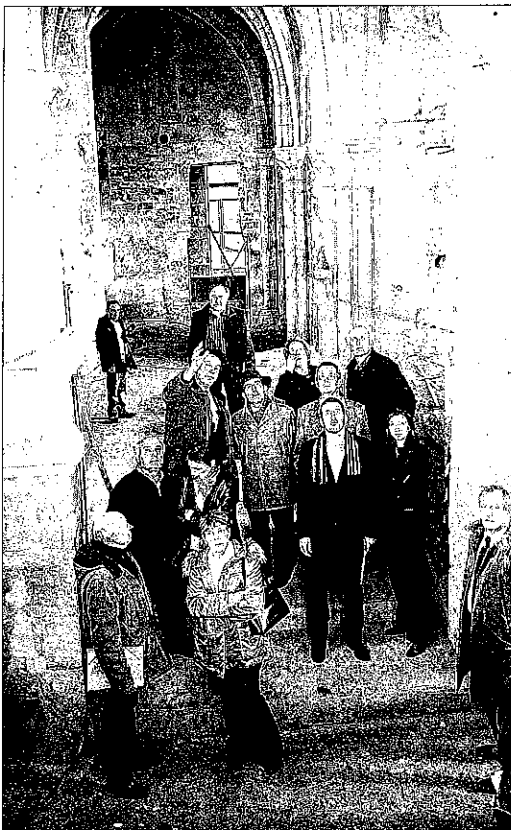
HISTOIRE. Depuis 1975, le musée Frédéric Blandin est installé sur le site de l'ancienne abbaye cistercienne Notre-Dame, fondée en 624.

La situation devient alors compliquée pour ce chantier, d'un coût total d'environ 10 millions d'euros et sur lequel 3 millions ont déjà été engagés. « Nous avons réagi en disant qu'il fallait tout mettre en œuvre pour continuer. Mon rôle était donc de trouver l'argent pour sortir du tunnel ».