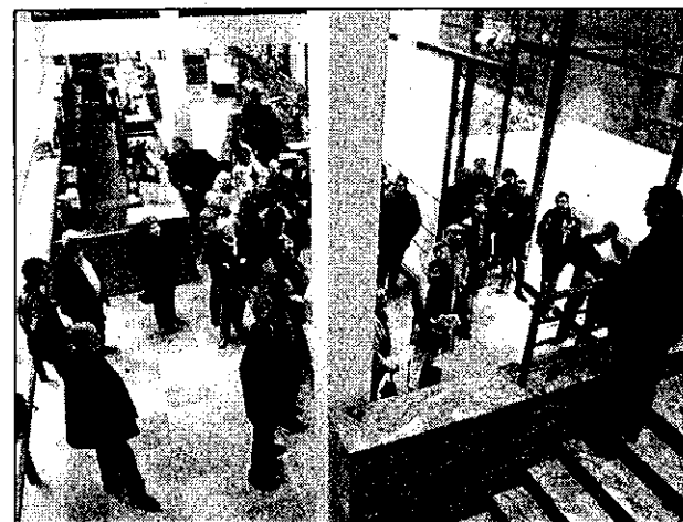
De nombreux invités pour l'inauguration de la chaufferie bois de Bibracte

Une visite ponctuée de conférences (bilan de fonctionnement de la chaufferie bois de Millay, méthodologie de projet, dis-